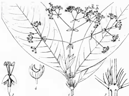
Pl. 1. — Schismatoclada longistipula : 1, rameau avec inflorescence \times 2/3 ; 2, stipules, gr. nat.; 3, fleur \times 2 ; 4, fruit \times 4 (Humbert 24348).

1,5 mm latis. Stamina in parte superiore tubi inserta, filamentis 4 mm longis, antheris exsertis plus minusve 1 mm longis, anguste oblongis. Stylus bifidus tubi apicem attingens. Capsula subglobosa 4-5 mm lata. (Pl. 1, 3-6.)